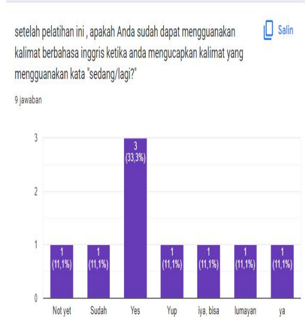
Diagram tersebut menunjukkan peserta hampir semua sudah mampu menggunakan kalimat sederhana menggunakan tabel tennis.

Setelah kegiatan selesai, pengabdian memberikan evaluasi pertanyaan terkait kegiatan dan bagaimana pemahaman peserta terhadap pelatihan. Evaluasi dari kegiatan dapat di gambarkan sabagai berikut :